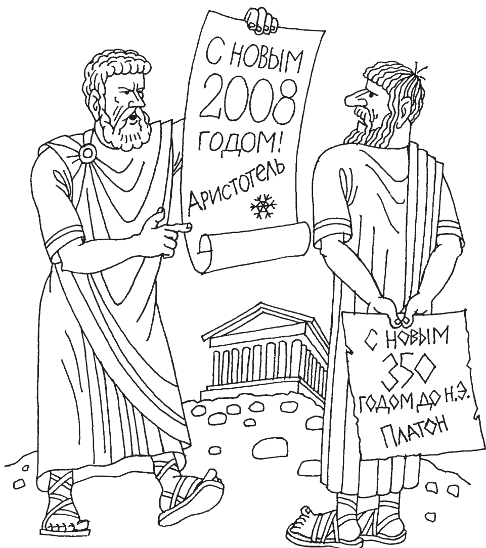
Рис. художника Михаила Шестопала